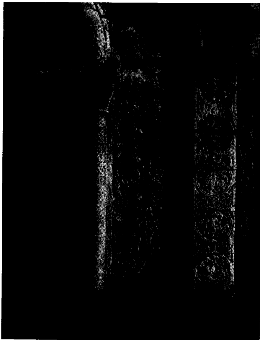
Pl. 4 Jur'ev Pol'skoj. Portail